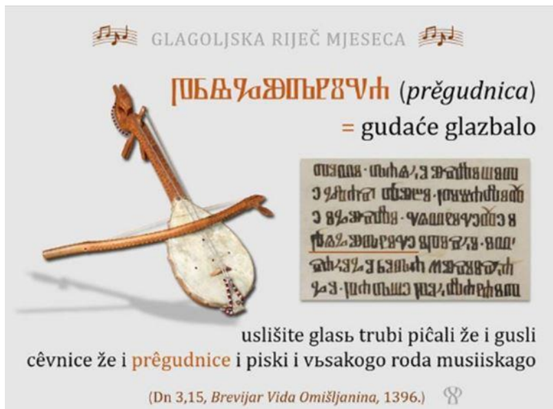
7. slika: Glagoljična riječ mjeseca studenoga