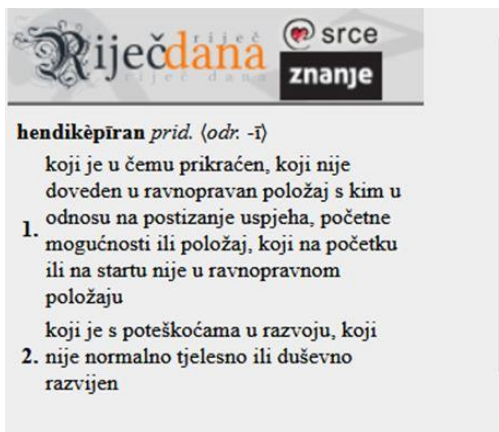
6. slika: Riječ dana na Hrvatskome jezičnom portalu

Osnovna škola Turnić Rijeka provodi za svoje učenike izbor za riječ mjeseca ( http://os-turnic-ri.skole.hr/?news_hk=1&news_id=6246&mshow=290 ). Pokrenut je prvo Rujanski izazov , a budući da je on izazvao veliki interes, učiteljice hrvatskoga i engleskoga jezika odlučile su u suradnji s knjižničarkom provesti nastavak izazova tijekom cijele školske godine. Cilj je učenje i upotrebljavanje novih riječi. Riječ je mjeseca listopada 2022. praskozorje .